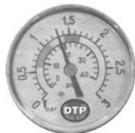
1,3 kg/cm2 -18,5 PSI: Esta presión indica que es necesario proceder al LAVADO